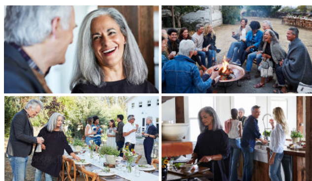
Edge Mode+ scanner automatisk, når lyd miljøet ændrer sig.