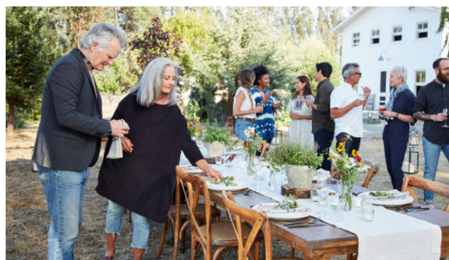
Genaktiver Edge Mode+ for at scanne igen, når lyd miljøet ændrer sig.