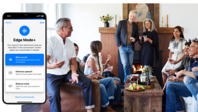
Aktiver Edge Mode+ og vælg derefter din lyttehensigt for yderligere personalisering.